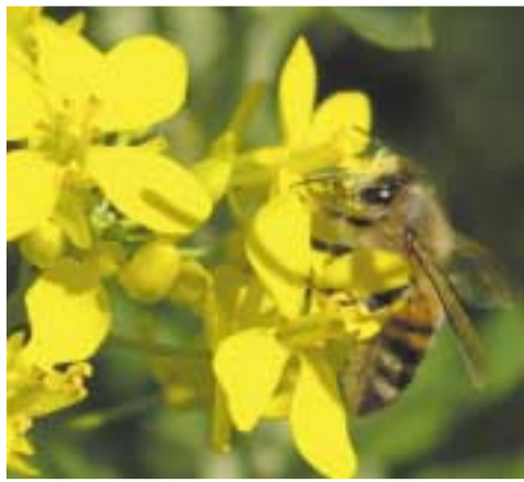
Pollineringsarbete av insekter i fruktodling