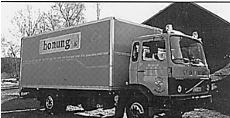
En rejäl bil ingår i företaget, att tala om att det gäller honung kan vara bra när grannarna ser bilen ute i skogen.

Efter klarningstanken finns en flytsil plus en pump som efter klarning ombesörjer honungens resa till ymptanken. Ymptanken har två mjölkromrörare på olika nivåer som blandar om sedan ympen hållts i. Det finns också en avtappningskran på lämplig arbetshöjd för fyllning av 20-litershinkarna. Ett som vi upplevde det stort kylrum för nedkyllning och förvaring av honung